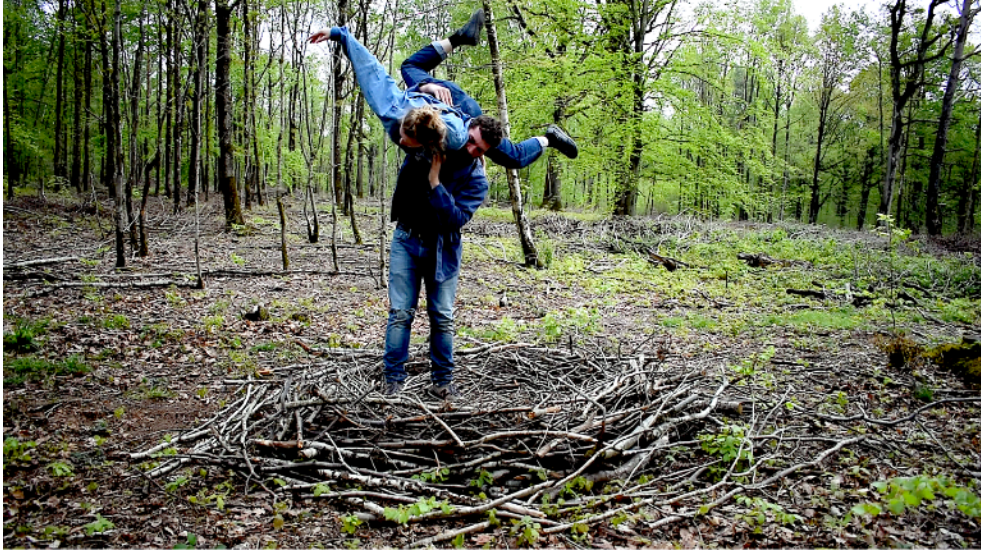
Nid Hulule, forêt de Rambouillet

NID fait partie d'un processus de recherches artistiques initié en 2018 par la Compagnie, intitulé : AVENTURES CHORÉGRAPHIQUES POUR PAYSAGES (+ OU - CULTIVÉS) À TAILLES TRÈS VARIABLES