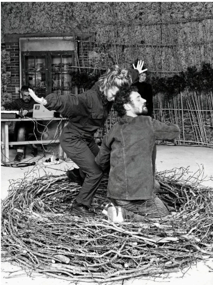
Nid Dodeldire

Il a la particularité d'imiter tous les sons présents dans son environnement pendant ses parades.